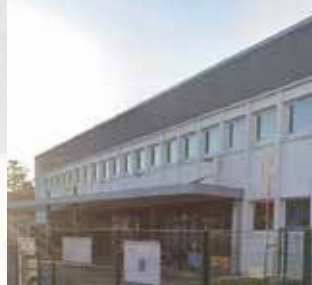
École élémentaire publique Mixte du Centre