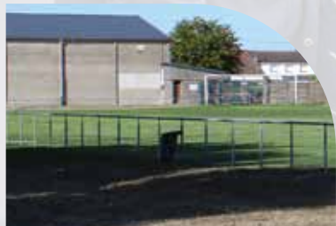
Stade Jacques Sery Rue des Hauts Champs