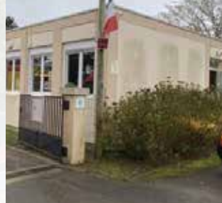
École maternelle publique du Centre