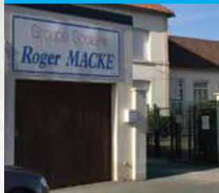
École élémentaire et maternelle publique Roger Macke