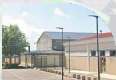
Salle des Hauts Champs Rue des Hauts Champs