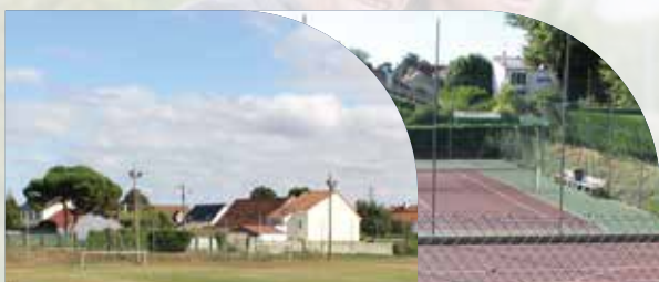
Complexe René Démarthe Salle de sport, terrains de tennis, stade Démarthe Rue Arthur Bart