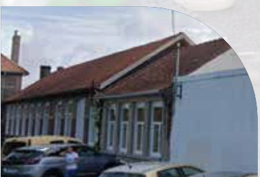
Complexe Briand, Ancien Collège Rue Aristide Briand