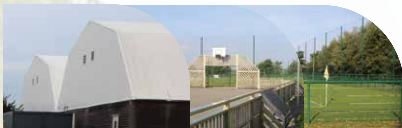
Complexe des Saules Salle de tennis, terrain canin, terrain synthétique Rue des Saules