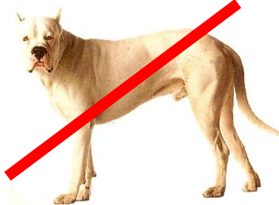
DOGUE ARGENTIN (très grand chien)