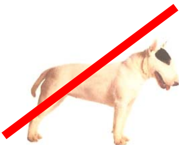
BULL TERRIER (museau droit)

CHIENS NON POTENTIELLEMENT DANGEREUX (molosses n'appartenant pas aux catégories des chiens dangereux, pas de déclaration en mairie, pas de vaccination la rage obligatoire)